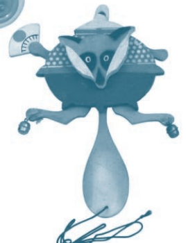
文福茶釜 (昭和4年12月購入)

今回の特別展で展示するおもちゃの多くは、株式会社三越呉服店大阪支店ならびに株式会社三越大阪支店から購入されたものです。これらのおもちゃたちは、奈良女子高等師範学校が当時、時代の最先端をいく児童用品の数々を教材として集めていたことを示す、貴重な資料となっています。明治39年、日本最初の児童博覧会といわれる「こども博覧会」が東京・上野で開催されました。この博覧会は、「学校および家庭の教育上に資すると同時に、子どもに清新なる娯楽を与える」ことを目的としていました。そのため、子どもの衣食住、読み物、玩具、絵画など、子どもに関するあらゆる品物が収集され展示されました。当時、家庭教育の重要性が注目され始めていたことは、博覧会の展示品が子どもの衣食住から教育、娯楽にまで渡っていたことからわかります。この時期には、特に玩具の教育的意義も意識されはじめていました。玩具の進歩の程度は、その国の文明開化の発達程度を示すものだと意識されていたようです。「児童への関心の高まり」を受けて展開されたこれらの活動は、子どもの生活に関するものを広く取り扱っていましたが、なかでも玩具の改良と考案に力が注がれました。家庭教育の重要性が浸透しはじめた明治の家庭において、遊びながら学ぶことのできる玩具は、子どもの教育という観点において関心が高いものであったようです。