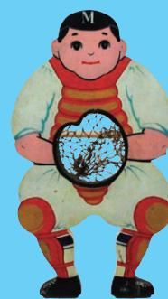
キャッチ玉投げ (大正15年3月購入)