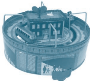
ゼンマイ仕掛 電車廻り (昭和4年8月購入)