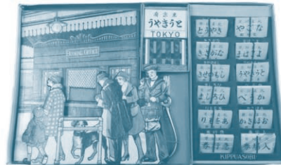
ライト付パッカード自動車 (昭和12年2月購入)