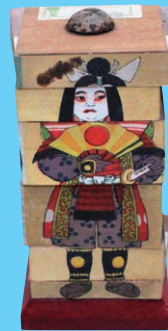
マーストヘンゲル (昭和3年1月購入)