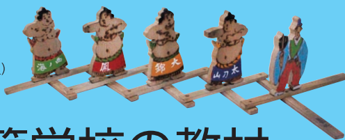
繰合せ(相撲) (大正11年2月購入)