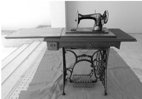
海外製足踏み式ミシン

奈良女子大学は、昭和初期に海外製足踏み式ミシンを複数台購入しています。戦前から実際の教育現場で使用されていた資料として貴重であるだけでなく、近代日本で販売されていた初期の海外製のミシン資料としても非常に価値の高いものです。近代日本では、明治期に富裕層から浸透し始めた洋装の文化とともに、ミシンおよびミシン教育が発展しました。奈良女子高等師範学校では、早くから授業に和裁だけでなく洋裁が取り入れられました。