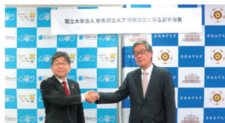
機構設立に係る記者発表

法人統合することによって得られるシナジーを最大限に活用することにより、「 学修者の主体的な学び 」をガバナンスの中心に据えた新たな教育・研究拠点の創出を目指します！