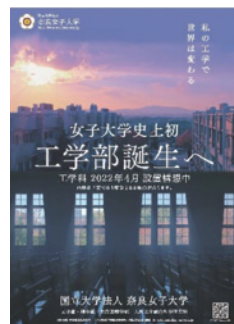
令和4年4月 設置構想中の 工学部チラシ