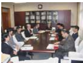
蘇州大学訪問団との会談の様子

基本理念に「開かれた大学－国際交流の推進と地域・社会への貢献－」を掲げている本学には、海外から数多くの表敬訪問があります。最近の主なものでは、中国蘇州大学長一行(H17.11.4)、サウジアラビア女性教育者一行(H17.12.9)、アフガニスタン若手記者(H18.3.7)、カブール大学薬学部長(H18.3.8)、南京大学国際合作与交流処処長(H18.3.23)、新疆ウイグル自治区政府代表团(H18.3.25)の来訪がありました。交流活動の推進や友好親善のための取り組み等について意見交換が行われています。