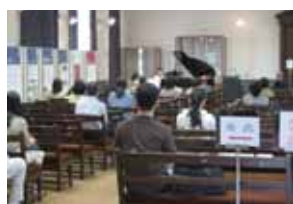
ミニコンサートの様子

今回は特別展示として、「奈良きたまちと奈良女子大学」として、大学周辺の近鉄奈良駅北側に広がる地域の魅力を紹介し、新しい観光地として提案計画する取り組みなどを、「現代的教育ニーズ取組支援プログラム(現代GP)」の活動の一環として紹介しました。また、今回は一般公開では初めて「女