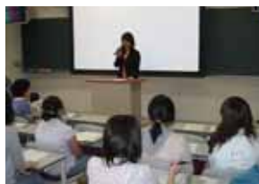
留学中の体験を語る学生

国際課、国際交流センターでは、本学日本人学生を対象として5月24日(水)に海外留学説明会を開催しました。国際交流協定締結大学への短期留学制度を中心としたもので、30名を超える参加者がありました。同制度は、本学での在籍身分を有したまま相手大学へ授業料などを払わず1年以内の期間留学ができ、本学が認定すれば履修単位の互換も可能なものです。