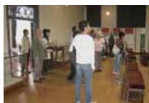
来館者で賑う館内

本学では、記念館が平成6年(1994年)に守衛室(附正門)とともに国の重要文化財に指定されたことを受け、重要文化財に対する理解と認識を得るとともに、開かれた大学として地域との連携を深めることなどを目的に、平成9年(1997年)から、毎年春と秋の2回記念館一般公開(入館無料)を開催しています。今年もゴールデンウィーク中の4月29日(土)から5月7日(日)までの9日間にわたり開催し、期間中1,751名の来館者がありました。