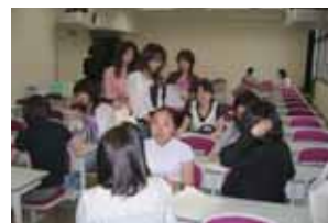
参加学生から相談を受ける学生

同制度を利用して、ミルズカレッジ(米国)、ノースカロライナ大学グリーンズボロ校(米国)及びソウル大学(韓国)への短期留学を終えて帰国したばかりの学生から、留学中の厳しい勉強、楽しいキャスライフなど、盛りだくさんな情報提供もありました。また、梨花女子大学(韓国)、西安交通大学(中国)からの留学生による母校の紹介もありました。留学を体験した学生が質問に応じる時間も設けましたが、大変有意義な楽しい説明会だったと参加学生から好評でした。