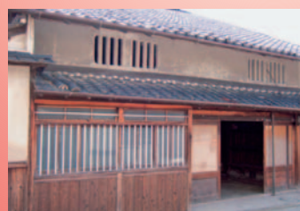
「奈良町セミナーハウス」として利用される正木家

正木家は奈良町のほぼ中央部に位置する毘沙門町にあり、町家特有の通り土間、土間には、かまど・井戸がのこり、棟には煙出しがあります。これらから、伝統的な住まいの様子がわかるだけでなく、土間上部の梁組が見え、伝統的な構造も理解できます。これらの構造・意匠からみて、明治時代前期の建物であると推定されます。