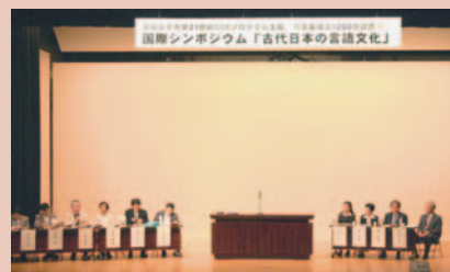
シンポジウムの様子

第3日目から5日目にかけては、若手研究者支援プログラムを開催。北は北海道・東北から南は九州にいたるまで全国の大学・大学院から60名を越える参加者があり、盛会でした。