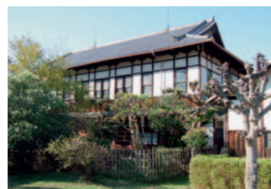
国の登録有形文化財に指定された佐保会館

がありその後、佐保会館の見学と建築史の視点からの説明がありました。「佐保塾」の他、佐保会では「佐保カルチャー」としての講演会企画も10月以降3件が予定されています。