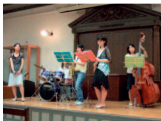
音楽系サークルによる演奏

学生寄宿舎、附属図書館、総合情報処理センターなどの施設見学のほか、記念館(国の重要文化財)では在学生音楽系サークル有志による演奏が行われ、オープンキャンパスを盛り上げ、参加者には大学の特色が十分に伝わった様子でした。なお、オープンキャンパスは年2回開催予定であり、次回は10月30日(日)を予定しています。