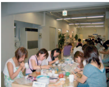
真剣に絵付けに取り組む留学生たち

さらに、「ノリタケの森」では、童心にかえて陶器の皿やマグカップへの絵付けを体験するなど、留学生相互の交流と親睦を