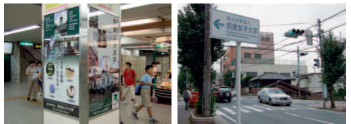
①近鉄奈良駅地下コンコースにイメージポスターを設置 ②大学周辺道路に大学の標示を設置

奈良女子大学広報企画室では、大学のイメージを内外に伝え、対外的に大学についての良好なイメージを社会に構築するコミュニケーション活動として、UI戦略に着手しています。