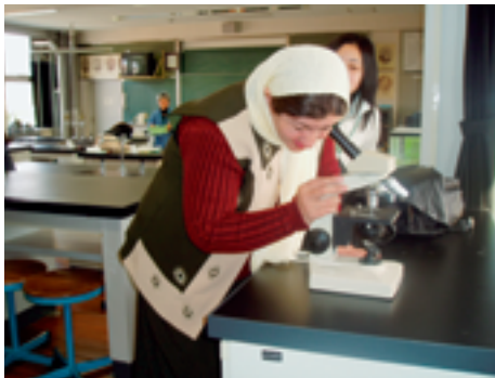
顕微鏡を用いての細胞観察 (附属中等教育学校)

は一生の思い出です。生きている限り忘れません。ここで学んだこと経験したことをアフガニスタンで実践してゆきたい。」と感想が述べられました。