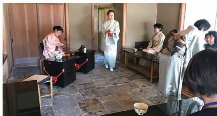
同窓茶会を1~2年に1回開催して、懇親の機会を持っています(2018年4月の様子)