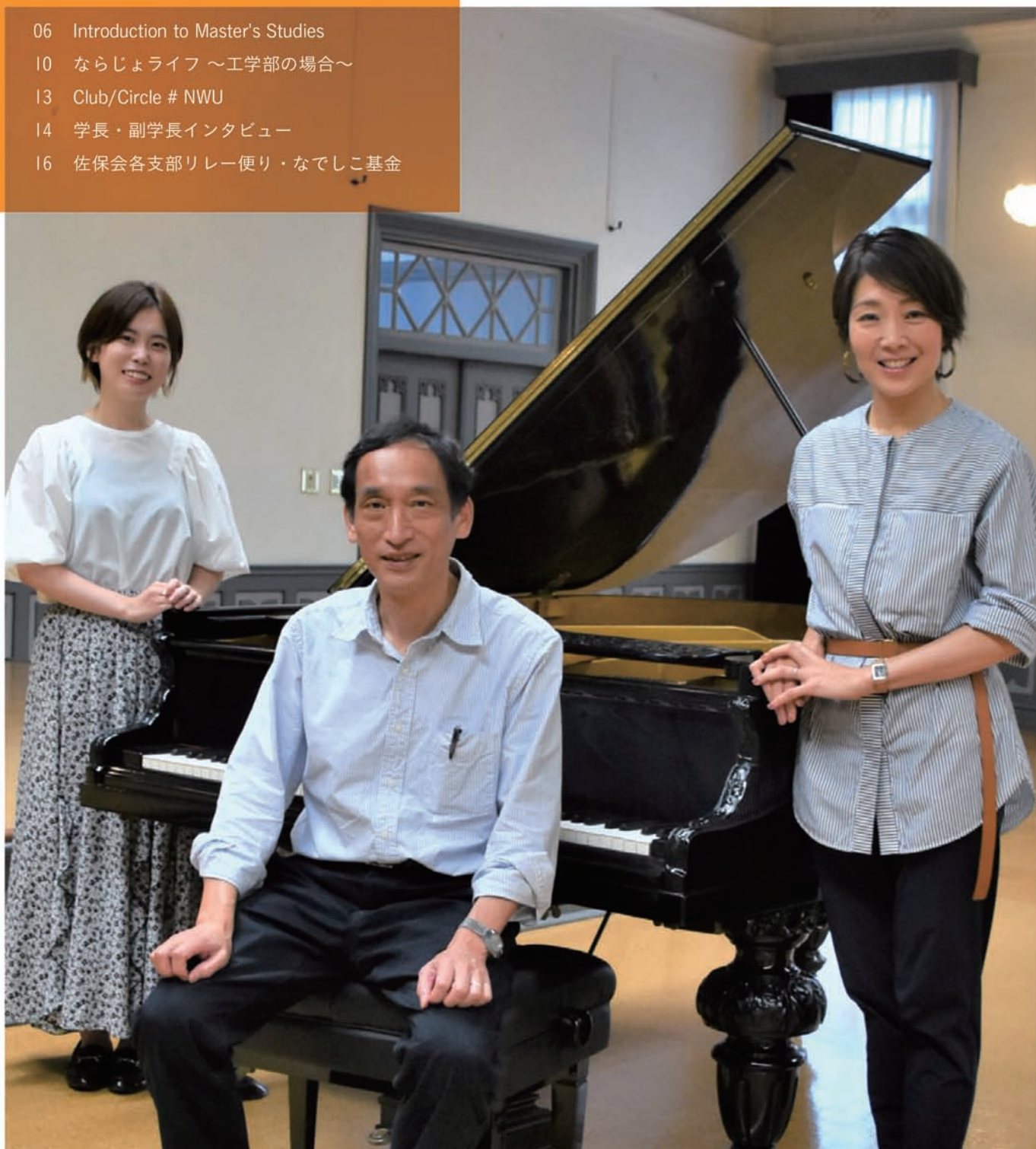
表紙：女性のキャリア—“わたしたち”のための選択をしよう— (P02-P05)