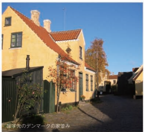
留学先のデンマークの家並み

学生に望むことは 齊田…失敗を恐れず、いっぱい経験して欲しいです。失敗は失敗ではなく、糧となつてそこからまた得るものがあります。大丈夫、振り返ればなんてことないです。また、年を重ねるとお金やスキルを使つことはできるけれど、時間を