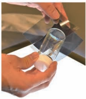
研究しているゲル素材

私は有機材料を研究しています。その中でも特に、ゲル状態をとるような材料を研究しています。ゲルというのは、ミクロな網目構造の中に水などの溶媒を含んで保っている状態のもので、ゼリーや寒天など食品でよく見られます。また人間や生き物もゲル状態を保っています。普遍的な例はクラゲです。水の塊ですが、生きています。誰もが知っている、身の回り、まさに生活の中にあるような素材の形態です。これを役に立つような材料にしたいと考えています。つまり、ゲル材料というような新しい材料を作っていくというところで研究を重ね続けています。ゲルというのは、微小な紐である高分子はたまた、微粒子が連なってできた紐状のものが、構成要素になつてつながりあつて網目状になっているものなのです。ですから網目の中は入カス力です。その中に、特別な機能を持った材料を混ぜ込むと、ゲルにその材料由来の機能を付与することができ、きるのではないかと考えています。プルプルと柔らかいゲルの良さ、混ぜ込んだ材料の良さを併せ持ったようなものができるのではないかと、いつかです。ですが、混ぜることでゲルでなくなってしまうかもしれませんが、逆にまた新しい網目構造ができて面白いことがあるかもしれません。さらに、すでに機能を持っている素材をゲル状態にすることで、ゲル材料を作ることでも可能であると考えています。