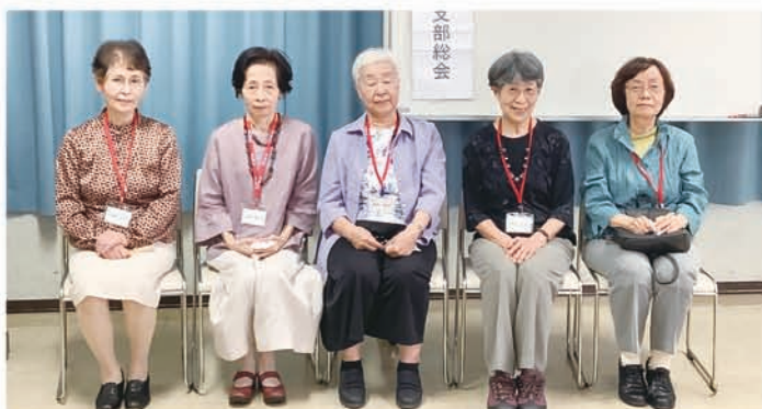
2022年6月支部総会時に行われた卒後55周年の方々への祝賀会での記念写真