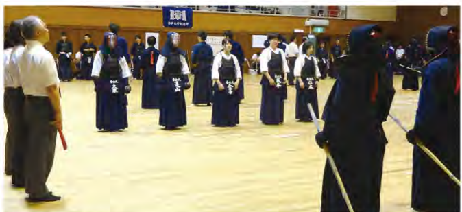
試合開始前の礼の場面

予期せぬ問題が発生しましたが、その度に話し合つて解決していききました。準備が進むにつれて団結力が強まつていくのを感じると同時に、毎年入賞を逃していたこの大会で入賞したい！という想いが強くなり、より一層稽古に身が入りました。