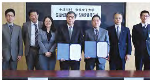
3月26日 十津川村と包括連携協定を締結