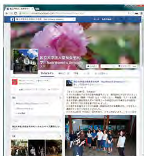
国立大学法人奈良女子大学Facebook

この度、本学ではTwitter（ツイッター）およびFacebook（フェイスブック）の公式ページを開設しました。イベント情報や大学の最新ニュース等をお届けしていきますので、是非フォローをお願いします。