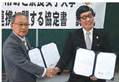
2月16日 下市町と包括連携協定を締結

奈良女子大学は奈良県吉野郡下市町、同郡十津川村、同郡野迫川村とそれぞれ包括連携に関する協定を締結（下市町:2月16日、十津川村:3月26日、野迫川村:4月1日）しました。今後、三町村の行う地域社会の活性化、産業の振興、教育・文化の振興および人材育成に関する事項や、本学が行う地域を志向した教育・研究および地域貢献事業などについて相互に連携・協力し、地域の課題に適切に対応し、活力ある個性豊かな地域社会の創成・発展を目指していきます。