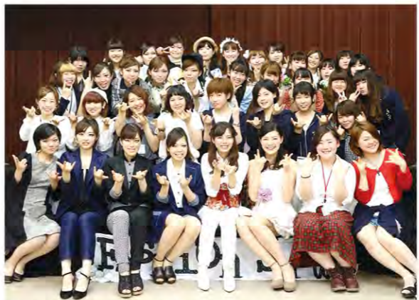
'15 NaraColle 新歓ファッションショー

私たちのショーを見てくださる学内の学生や外部のお客さん、そして一緒にショーを創り上げる部員全員にとつて、衣服と触れ合う機会を増やし、自己表現やファッションの幅を広げたり、ファッションの楽しさを身近に感じてもらえたりするようなサークルにしていくことが今後の私の挑戦です。