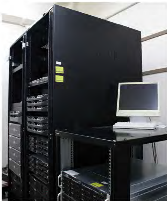
研究室内に導入したデータ解析計算機システム。96個のCPUコアと140TBのディスクアレイを装備する。

ティックハドロンの研究です。例えば陽子や中性子だと、構成子として入っているクォークが三つで、湯川先生の理論で出てきたパイ中間子では、構成子として入っているのがクォークと反クォークの二個ずつで二体なので、しかしここ10年程の間に、これら一般的な二体や三体ではなく、四体あるいは五体入っているものがたまには