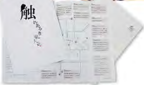
触れあるき東大寺(触る観光のための地図)