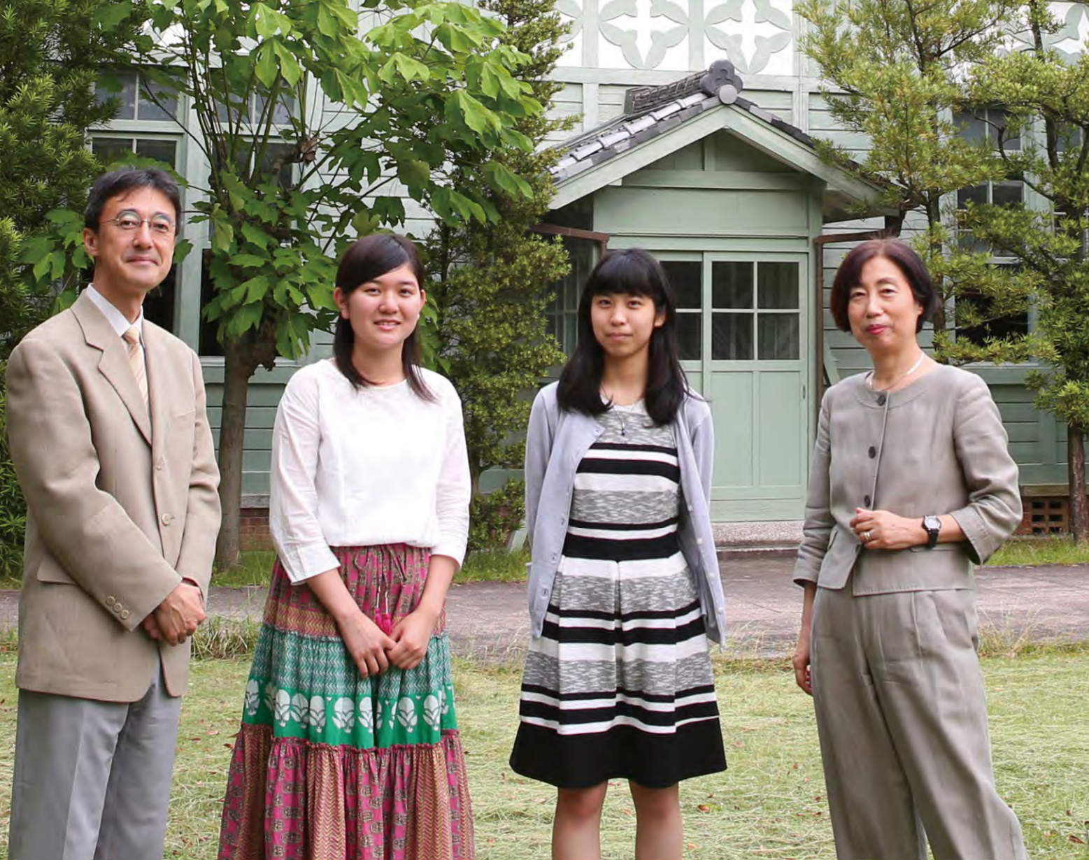
対談後、大学中庭で撮影