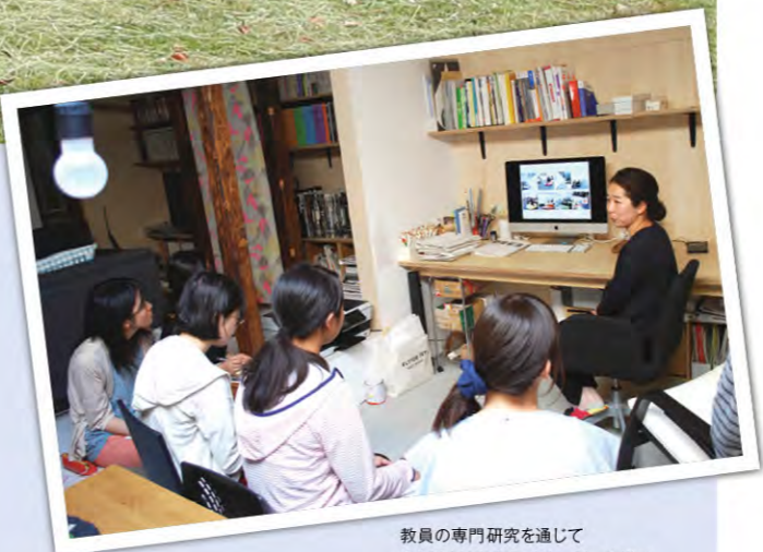
教員の専門研究を通じて「大学」と出会うパサーージュの様子