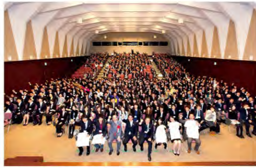
第2期派遣留学生壮行会の様子

2014年からスタートした海外留学支援制度で、政府が官民協働で取り組んでいます。2020年までの7年間で約1万人の高校生・大学生が「トビタテ!留学JAPAN日本代表プログラム」の派遣留学生として送り出される計画です。派遣留学生は支援企業と共にグローバル人材コミュニティを形成し、「産業界を中心に社会で求められる人材」、「世界で、又は世界を視野に入れて活躍できる人材」へと育てます。帰国後は海外体験の魅力を伝えるエヴァンジェリスト(伝道師)として日本全体の留学機運を高めることへの貢献が期待されています。以下では、本学から選出された2名の学生の、応募から事前研修までの様子を紹介します。