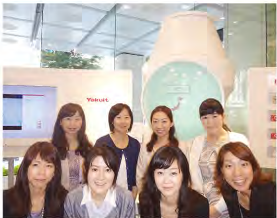
社屋にてメンバーの一部が集まりました

開発プロジェクト「三ツ星 Factory」の二員として、20・30代女性をターゲットとした商品開発にも参画し、公私ともに多忙な女性の悩み解決やこだわりを叶える商品作りに励んでいます。食、に関わる仕事は、人の口に入るものなので命に影響を与えるという緊張感もありますが、商品を通じて人を笑顔にもでき、健康を支えるという責任や喜びも大きく、やりがいを感じています。今後も奈良女での学びや経験を礎として、商品に想いを込め、人の笑顔や健康につながる仕事をしていきたいと思っています。