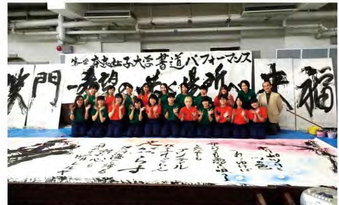
昨年の学祭での書道パフォーマンス

書道部で実感しています。また、仲間と一緒に、共同作品の制作や、展覧会の準備、書道パフォーマンスの練習をすることも、楽しみの一つです。自分では思いつかないような面白い作品に刺激されながら、「次はどうしようか」とわくわくでき、納得するまで書道に向き合うことができるこの書道部に居心地の良さを感じています。これからも「楽しく」をモットーに古都奈良の地で書に親しんでいきたいです。