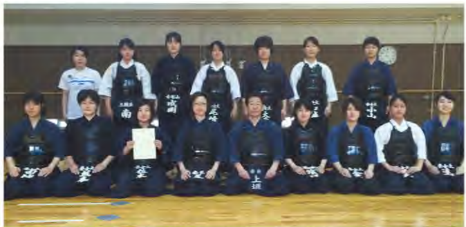
第52回近畿地区国立大学体育大会(剣道競技)