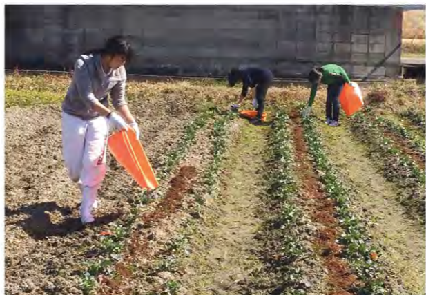
2月の除草・堆肥まき作業の様子

野菜の絵を見せてその旬の季節を当ててもらつ、「旬当てゲーム」をしました。ゲームの後には、旬の野菜がなぜ「旬」なのかを楽しく学んでもらえるよう、自分で準備した絵を見せながら、易しい言葉で説明しました。私はこのプロジェクトに参加して、世の中を良くしたいという強い思いで活動されているたくさんの方々に出会いました。私もこれから、その方々に負けないぐらい力強く活動していきたいです。