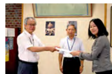
学長から決定通知書を 授与される学生

今年度も外国人留学生9名、派遣留学生3名を対象に奨学金採用決定通知書授与式を挙行了しました。式では、野口学長から対象者に決定通知書が授与されるとともに、基金設立