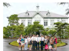
記念館前で記念撮影

☆7月13日、北京の首都経済貿易大学会計学院の学生12名が本学を訪れました。小山国際交流センター長から、大学の歴史などについて学んだ後、図書館では「奈良地域関連資料画像データベース」について説明を受けました。