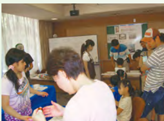
物理科学科ブース

9月11～12日、奈良県下で13回目となる「青少年のための科学の祭典 2010」奈良大会を本学にて開催しました。この大会は、青少年の理科離れが大きな社会問題として指摘されている昨今の情勢の中、小中高大学の理科、算数・数学教育に携わる教員が中心となって青少年に科学の面白さ、夢中になって追及する楽しさを伝えることを目的としています。会場には教育機関や企業による約50の展示ブースが設置され、本学からも7つの出展を行いました。とりわけ理学部物理科学科はサイエンス・オープンラボの授業の一環として参加し、光と電気に関連した身近な物理学の楽しさを紹介する学生たちの前には絶え間なく子どもたちが訪れていました。また、附属中等教育学校は「猿沢池の七不思議を探る」と題して、生徒たちが採集したプランクトンなどを披露しました。