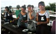
海鮮バーベキューは楽しい！

8月10日、今年3回目となる日本人学生と留学生の交流を図るためのイベントを実施しました。初めに、参加した学生らの紹介を兼ねてレクリエーションゲームで親睦を深め、その後、泉州岡田浦で地引網とバーベキューを体験しました。お土産には、獲れた魚を持ち帰るなど、真夏の1日を楽しみました。