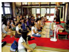
座禅：両足を上げられる人は 余命30年保障！