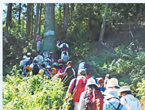
ヒノキ植林内登山