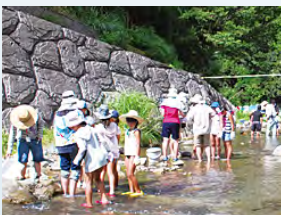
四郷川での生き物観察

8月28～29日、豊かな自然に恵まれた東吉野村にて、共生科学研究センター主催による野外体験実習を開催しました。参加メンバーは、小学生36名とその父兄10名で、1日目は清流、四郷川に生息する魚や水生昆虫の観察を、2日目は森作り体験として、約1時間ヒノキ植林内を登った後に、地元林業家の方の指導を受けながら下枝切りを行いました。厳しい暑さの中でも、皆、額の汗を拭いながら、仲間との語りを楽しみつつ、都会では体験できない自然との触れ合いを満喫した様子でした。体験は学びの土台・出発点です。今回の体験実習が、ひと夏の貴重な思い出となると同時に、子どもたちのその後の学習意欲や環境保全への意識向上につながることを期待されます。