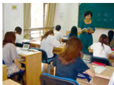
南京大学での講義の様子

8月20日～9月17日、恒例となった南京大学での4週間の中国語語学研修を実施しました。研修生14名は、充実した学修を終え、無事帰国しました。この研修を経て、中国への留学を考える学生が増えており、語学研鑽に自信をつける良い機会となっています。