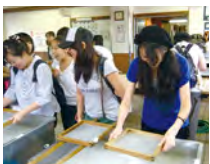
手漉き体験： どんな作品ができるかな？

9月16～17日、日本の歴史・文化・自然等について理解を深め留学生相互の親睦を図ることを目的として、福井方面への見学旅行を実施しました。1日目は、伝統的な越前和紙の手漉き体験と大安禅寺において座禅を学びました。2日目は、東尋坊を見学しました。荒天の影響で、予定していた船からの見学ができなかったのですが、行程を一部変更し、有名な越前竹人形の工房を見学することにしました。また、名産のかまぼこ作りにチャレンジし、形はいびつながらも、できたての美味しいちくわやかまぼこをいただきました。2日間を通して、伝統を守り、自然の恵みを利用した伝統的な産業を知ることができ、貴重な日本の文化研修となりました。