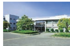
附属中等教育学校

文部科学省では、平成14年度から、将来の国際的な科学技術系人材を育成することを目指し、理数教育に重点を置いた研究開発を行う「スーパーサイエンスハイスクール(SSH)」事業を実施しており、附属中等教育学校は平成17年度にSSHの指定を受けました。そして昨年度までの5年間の研究で高い評価を受け、平成22年度から新たに5年間、『中等教育6年間に於いて、自然科学リテラシーを基盤とするリベラルアーツの育成のためのカリキュラム開発と、高大接続のあり方についての研究開発』をテーマとしてSSHに指定されました。