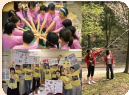
学生が主体となった活動の様子

今回の受賞では、歴史的市街地に立地する大学を地域社会変革の拠点にと、学生を中心とする奈良の文化・伝統食材の配信プロジェクトを推進してきたこと、また、数々の奈良らしい商品を地場企業と創出し、学生の実践的な育成とともに、地域や産業の活性化につなげてきたことが評価されました。