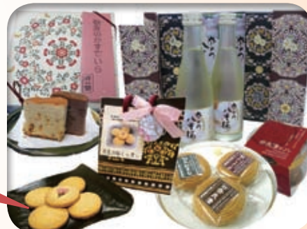
本学が開発に携わった商品