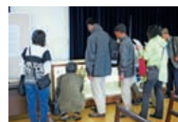
「雲珠」を見学する来館者