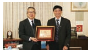
ベトナム国家大学ハノイ外国語大学学長と