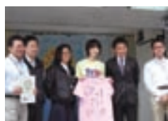
インタビューに応じた本学教職員など

「奈良漬アイス」は奈良の伝統ある食材を使って地域活性に貢献しようとする「奈良の食プロジェクト」の一環として、3年前に商品開発が始まりました。スイーツに合う奈良漬を見つけるのは難しく、また、調理法は試行錯誤を重ねた後に、一度茹でた奈良漬を使用することになりました。そうすることで、奈良漬独自の風味と歯ごたえを残すことができました。ほのかに香る奈良漬の香りとシャキシャキとした食感が好評です。ぜひ一度ご賞味ください。