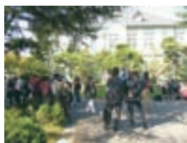
撮影の様子(記念館前)

5月から日本でもWOWOWで放送が始まった韓国テレビドラマ「スターの恋人」。そのドラマ撮影が、昨年10月中旬に計7日間の日程で、本学正門付近や記念館、中庭を中心に行われました。ドラマは、韓国の有名俳優で日本でも人気のチェ・ジウやユ・ジテが主演するラブストーリーで、本学記念館はドラマの中で非常に重要な舞台となっています。