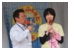
奈良漬アイスを紹介する本学大学院生(右)

4月20日(月)、NHK「ここはふるさと旅するラジオ」の収録が記念館前で行われました。多くの教職員・学生らが見守る中、本学開発商品である「奈良漬アイス」や、清酒「奈良の八重桜」(前頁掲載)の紹介がなされました。