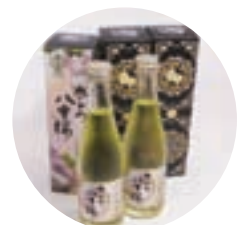
清酒「奈良の八重桜」

フルーティーで、白ワインに似た味わいがあり、冷やすと美味しいお酒に仕上がっています。