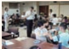
小学生向け講座 (数学教室)

一方、本学近くに位置するけいはんな学研都市においても、様々な先端的研究機関が、出前授業、施設公開やフォーラムの開催などを通して「研究機関」と「地域市民」との交流を促進する活動を展開しており、本学はこれらの機関との連携も図ってきました。本事業、「まほろば・けいはんな科学ネットワーク」は、こうした研究機関や近隣自治体との連携をさらに強化することで、それぞれの特色を活かした地域への科学普及活動の広がりを実現するとともに、新たな活動の展開を目指しています。