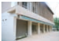
大学ラウンジ外観

文学部南棟1階に、待望の大学ラウンジが完成しました。天井面には可愛い桜の花びらがかたどられ、また入口自動扉にも桜模様を見ることができます。実際使用できるのはまだ先ですが、構内の癒しの空間となることが期待されます。