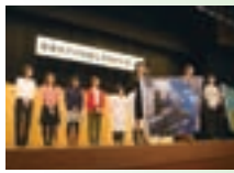
学生リリーススピーチ