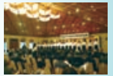
奈良女高師校歌斉唱