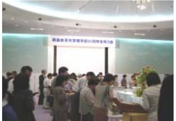
懇親会で歓談する参加者

平成15年8月1日(金)に、奈良県新公会堂において「理学部50周年を祝う会」が開催され、これまで理学部に貢献されてこられた先輩諸先生方や卒業生ら約180名の方々が参加しました。理学部長、学長、さらに退官された教官等からの祝辞のあと、本学理学部を基盤に研究を続けてこられた各学科の先生方の講演会が行われ、参加者は熱心に耳を傾けていました。夕方からの懇親会では、50年を振り返る写真上映会を楽しむなど、和やかな雰囲気の中に幕を閉じました。