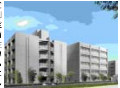
完成予想図(総合研究棟は右側)

総合研究棟H棟は今年の2月から建設が進められていましたが、10月に完成予定で、11月から利用を開始する予定です。大学の教育研究の一層の活性化が求められている現在、特色ある教育研究の進展に寄与する施設として建設が進められていたものです。