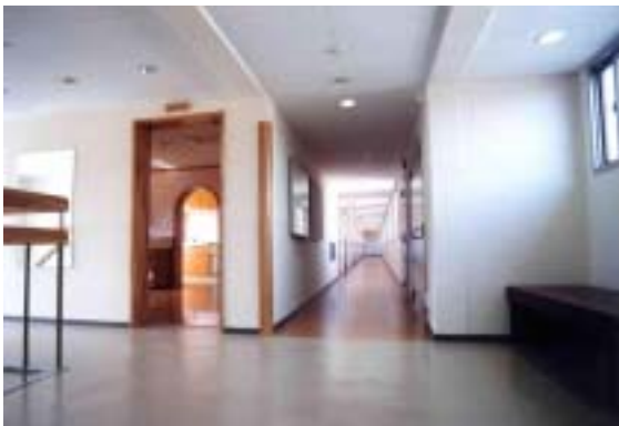
改修整備された寄宿舍

昨年から工事が行なわれていた寄宿舍の改修が進み、この11月に全て個室として完成予定です。各個室にはユニットバス・ベッド・エアコン・冷蔵庫・勉強机・ワードローブ等が整備されています。各ブロックごとに調理場所としての補食室が設置されています。また洗濯機と乾燥機を備えた洗濯室を設け、寮生相互の交流を図る場所としてリビングスペースを設置しています。この寄宿舍の完成により、国際学生宿舍と併せて定員は340人となります。この改修によって、本学に入学した女子学生が女高師以来伝統的に受け継がれてき