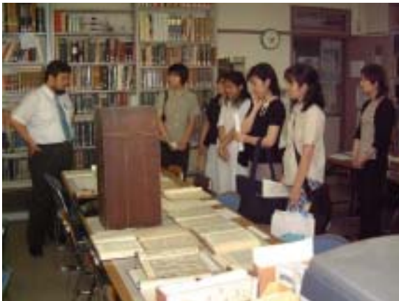
日本アジア言語文化講座で写本を見学する参加者

入学志願者を対象としたオープンキャンパスが8月2日(土)に開催され、猛暑の中749名の志願者・保護者が参加しました。志願者はそれぞれの学部・学科で模擬授業や、実験・実習などを体験したり、創立当からの建物である記念館や図書館を見学しました。第2回目のオープンキャンパスは11月2日(日)に開催されます。