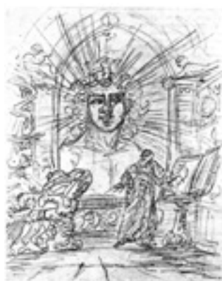
『ファウスト』の地霊

作品のあちこちに登場する意味不明な化け物たちのなかで、比較的まともそうなのが地霊だ。地霊はこんなこと