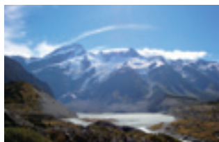
マウントクックにて

中でも、第二週の週末に有名な観光地のマウントクックへのツアーに参加したことは一大イベントだった。ワンボックスカーで四〜五時間かけて南島の中央部に向かう。途中、牧場や初めて見るミルキーブルー色の湖で休憩し、写真もたくさんとった。どの景色も息をのむほど美しかった。目的の山麓は草原というより荒野という感じだった。山中腹以上には氷河がまだ残っていて、それが崩れるような音を一度聞いた。普段見る風景とは全く違うものが目の前に広がっていて、何だか自分がこの地に立っていることが不思議でなかった。夜空には今まで見たことがないほど多くの星が広がっていた。天の