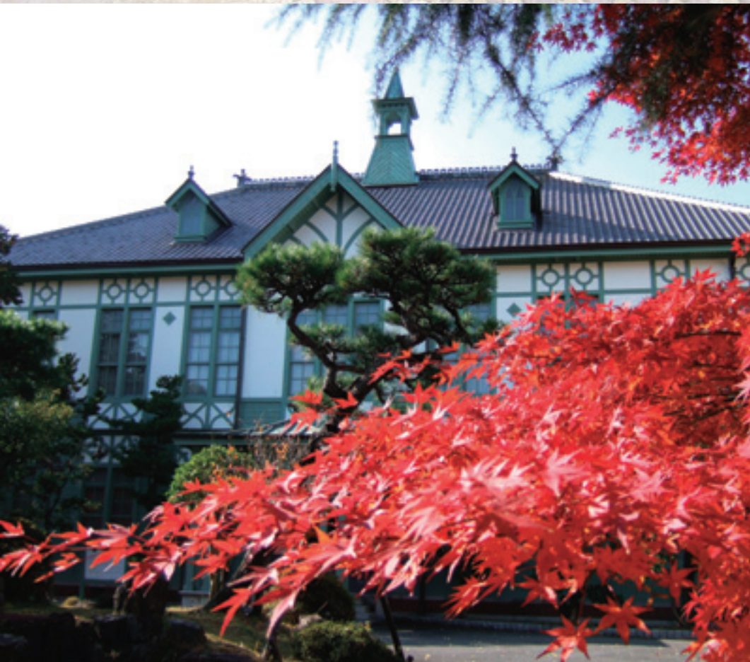
記念館秋景