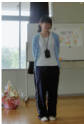
特別支援学校にて

次に赴任したのは特別支援学校の高等部でした。前任校を去る時に、「特別支援学校は教育の原点だよ」という言葉をもたらったのですが、本当にその通りだと思ふことが何度もありました。