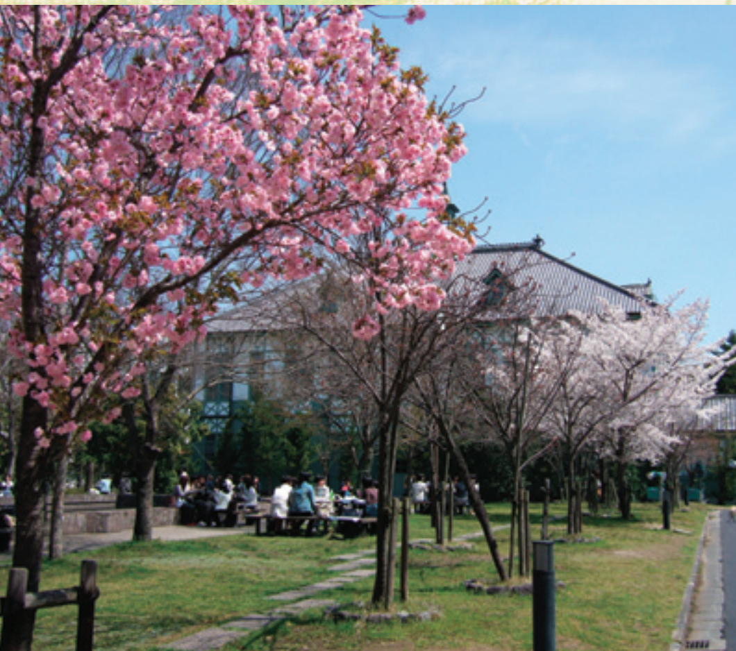
記念館春景