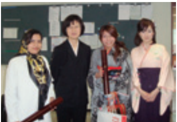
修士課程卒業の記念写真

二〇〇七年三月に、私は奈良女子大学の修士課程を修了し、国へ帰り、アフガニスタンで仕事に就きました。でも、どうやって日本へ帰れるか、いつも考