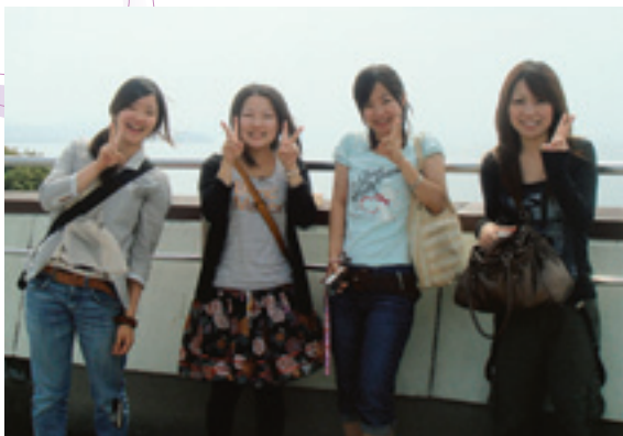
3回生の住環境学外演習（合宿演習）にて私と同じ編入・転学科の友人と

か乗り越えられるのも、本当に友人に恵まれたからだと思っている。大変だけれど、笑いあえたり相談しあえる友人がいるから、不安なことも忘れて笑って乗り越えられる。奈良女子大学で良かったと思うことは、そんな仲間に出会えたこと、先生が素晴らしく、そして身近であるということ。見守ってくれているという実感があるということだ。私のような学生を受け入れてもらえて、本当に感謝である。入学した時点で三回生であるし、忙しいこともあってサークルには入れなかったが、なぜだろうかととても充実している。