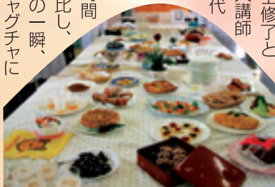
佐保短大調理実習

二年前、修士修了と同時に佐保短大講師となり、次世代を担う夢一杯の学生達に「調理は偉いもの、料理として仕上げるまでの時間とエネルギーに比し、食べるのはほんの一瞬、口に入ればグチャグチャに