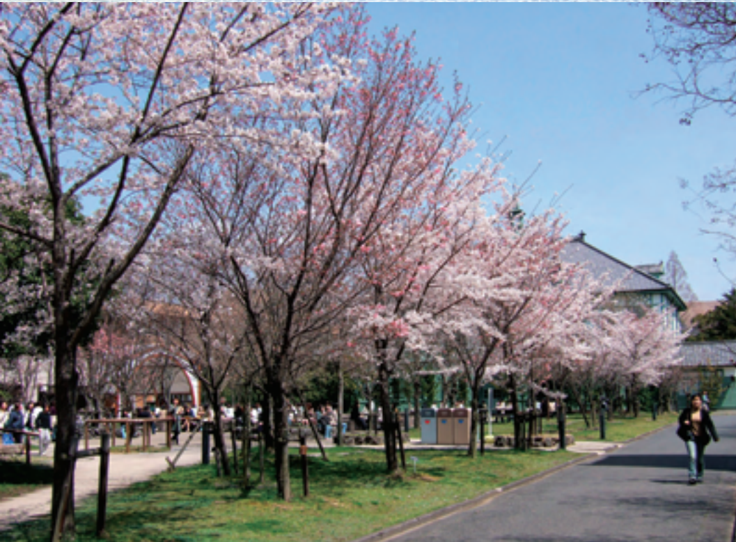
大学構内の桜満開(奈良女子大学メールマガジン-051-号より)