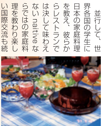
自宅でのお料理教室

振り返ると…大学卒業後、何気なく結婚・退職・出産、配偶者の転勤で活気溢れるエキソチックな香港で遊び暮らし、帰国してみれば社会から遠く離れた退屈な主婦になっていた。「どんな時でも少しでもいいから社会に関わって生き生きしていよう」と思っていたのに。でも管理栄養士資格のおかげで講師の職を得て教鞭をとりつつ、製菓衛生師の資格も取得した。