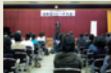
スピーチ大会の様子

スピーチ大会終了後は、大学生協食堂において、学長主催留学生懇親会が開催されました。留学生のほか、日本人学生・教職員・留学生支援団体関係者等が多く参加して下さり、たいへん盛会となりました。新入生の紹介のあと、留学生による母国の歌やダンスの披露が始まり、最後は学長・副学長とともに手をとって、輪になって踊る和やかな集いになりました。