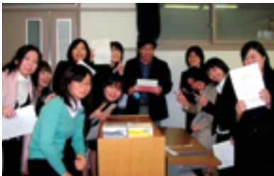
修士論文発表後院生の仲間と

奈良女子大学での生活が、夢へ続く道であるとも感じていた。今、こうして教師として充実した毎日を過ごせているのも、あの時、あの場所であつたはずでの人のおかげである。いつも支えてくださった先生方、