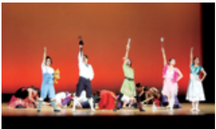
恋都祭公演 舞踊劇「ピーターパン」 ピーターパンと海賊たちの戦いの後、ピーターパンたちの勝利のポーズ

2007年11月4日、第6回舞踊部恋都祭公演が幕を閉じた。今年の舞踊劇「ピーターパン」は、すべての舞踊部員が、心から楽しんで踊り、演じる舞台をお客様に見てもらえたのではないだろうか。私たちの力を出し切り、完全燃焼した舞台であった。