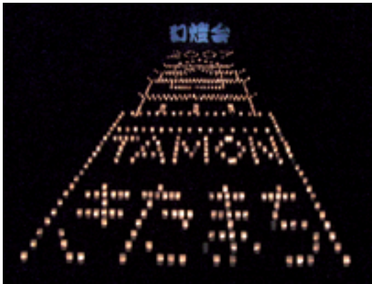
若草中学校の幻燈会

若草中学校の大階段に口ウソクの灯りで一晩だけ出現する「多聞山城」は地域の皆さんに支えられて「きたまち」の夏の風物詩となってきました。