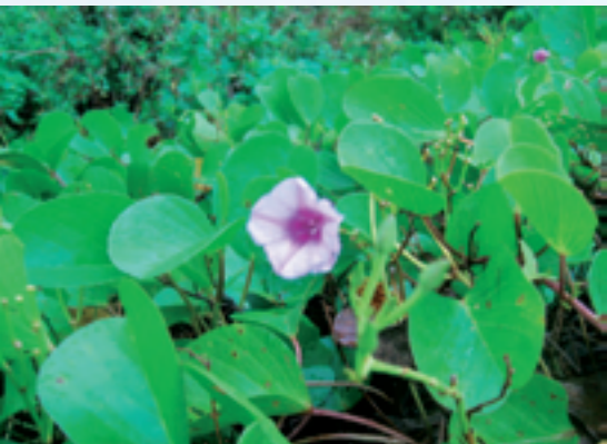
定年前に熟成した研究対象のグンバイヒルガオ。沖縄屋我地島にて。

科長なるものを二回もやる羽目になり、自分の研究が犠牲になったことが痛かった。定年前の三年間は共生科学研究センター長を勤め、小中学生相手の野外実習等々の地域貢献にも成果を挙げることができましたが、これも自分の研究に費やせる時間を減らすことになったのは否めません。しかし、定年を目の前にした平成十八年から、生物学の常識を覆しそうな研究に没頭し、面白い結果が得られたのは救いでした。十年間、有り難う御座いました。それにしても大変だった。さようなら。