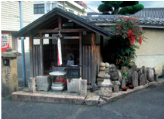
川久保町の地蔵尊

「きたまち」には無数の地蔵石像が道路の端に祀られてあるのを見ることが出来ます。称名寺の千体地蔵の縁起によれば、これらの地蔵は多門町にあった多聞山城の廃城跡に打ち捨てられてあったのを集めて祀ったとあります。町のあちこちに集められて祀られてある地蔵さんは同型のもので、佐保川から上げられたものが多く、川沿いに〇〇地蔵と名付けられて数体から数十体祀られてあります。地面からの目線で「きたまち」の盛衰を見つめてきました。