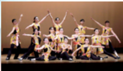
恋都祭公演 小作品集 一回生学年の踊り「功名が辻」より

改めて、舞踊部に入部し、すばらしい舞踊部員に出会えたことに心から感謝した。そして、いろいろな人に支えて頂いているということを実感した恋都祭公演であった。舞台で踊ることは緊張する。けれども、ライトを浴びて踊ることはそれ以上に楽しい。そして、お客様から拍手をいただいたりすると、今までの苦労などが吹き飛んでしまふ。