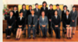
川崎佐保会理事長と久米学長を囲んで記念撮影