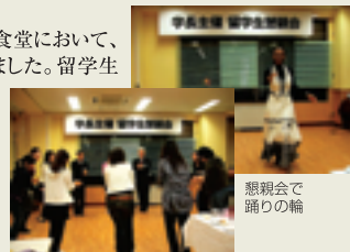
懇親会で踊りの輪