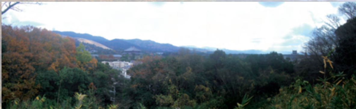
多聞山城跡からの遠望

ルとして多聞山城の再建を目指しています。奈良女子大学も「きたまち」のエリアにあります。是非、きたまちの住人として、「空」の部分を掘り起こしつつ、新たな「きたまち」の将来像を作り上げていきたいと思います。