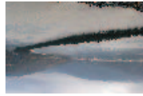
日本三景色 一天橋立 股のぞき台から撮った。頭に血がのぼつたが、綺麗な写真とれて満足。

日本に留学するきっかけは、一つ目は本国で日本語を勉強していたことだ。そして、二つ目は日本に行つてその国のことを知ることに、よりたくさんのことを知りたいと思つたことだ。