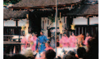
京都葵祭り 伝統を守つていこうという熱意が強く感じられた。

ができるかどうか、勉強がうまくいくか、友達ができるかどうかなどと心配していた。しかし、実際に来てみたら、皆さんはとて母親でたくさんの助けをいただき、来日前の不安はまるで嵐の後のように吹き飛ばされた。自分が困っていることを気付いてもらい、助けてもらうことを待つのではなく、自分も積極的に環境に馴染むべきだと思つた。 私は現在留学の三年目に入るところであり、たくさんのことを学んだ。授業や正式の場のような大勢の人がいる所で発言するのが苦手である私はそういう自分を变えたいと思ひ、他人の前で少しづつ語れるようになった。 また、日本人だけではなく、その地域の留学生と交流しているうちに、ほかの地域