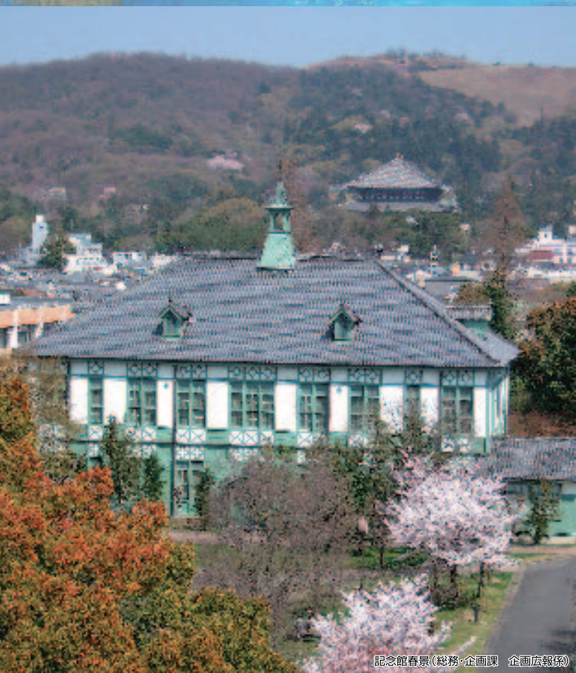
記念館春景(総務・企画課 企画広報係)