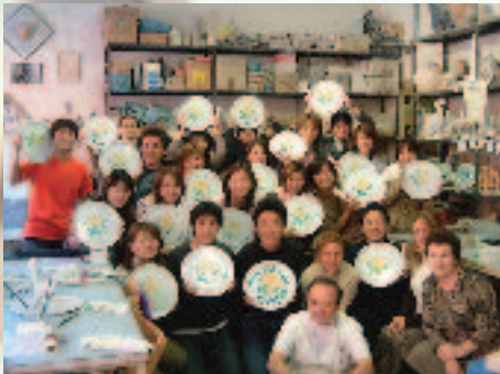
ギリシャでの給付け体験

分の小ささを痛感した。多くの人から学んだことを、人に還元したいという気持ちから、採用の仕事では、講演活動を通して、学生の皆さんに仕事の楽しさや仕事に対する姿勢などを伝えている。そして、私自身も可能性を狭めず、謙虚に学んで行きたい。会社の制度に医師、弁護士、税理士、調理師などを育成するコースがある。この制度を利用することもできるし、自分で新しい企画を立ち上げるのもいい。いつまでも次々と起こることにワクワクしながら、楽しんで仕事をしたい。