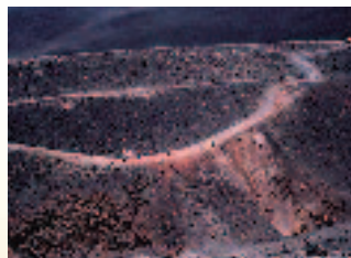
イタリア シチリア島 エトナ火山

リア、シチリア島 東北部の都市カタ ーニャを訪れまし た。古代ギリシャ の自然哲学者エン ペドクレスが火口 に身を投げたと伝 えられるエトナ活 火山の麓にあり、 灰から美しく再生した都市です。ローマ 時代の名残の遺跡があちこちに残り、又 作曲家ベルリニーを生んだ文化の町でも あります。