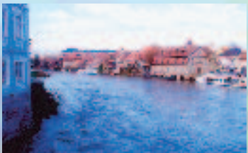
ドイツ バンベルクの町を流れるレーグニッツ河

間にも豊かな交流が続くことを願ってやまない。 ところで、奈良の住居の近辺を小さな川がちろちろと流れている。