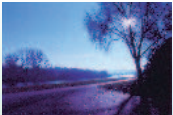
ドイツ モーゼル河とトリアの町並み

寒気の厳しい昨年十二月、夏季に続いて、ドイツ最西部のトリアー大学に出講した。合間には、ローマ人たちも往来したはずの、たゆまないがら流れるモーゼル河の水に歩調を合わせて河畔を歩いた。そのトリアー大学との間には、今春、部局間ながら学術交流協定が結ばれる。すでに多くの交換留学生や研究者が学んだこともある協定締結大学の場合と同様、トリアー大学との