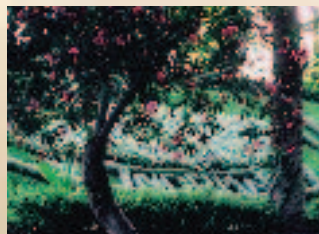
イタリア カターニャ ベルリニー公園

時代によつて人々の考え方、表現方法は変わりますが、学問や教育の精神は受け継がれて行くものと思えます。まだまだ奈良には沢山の自然が残されています。世界遺産に学びともに歩むまち奈良にあつて、伝統と共に、小さくてもよい、よく見ればきらりと光る本物の石であつて欲しい、ずっと光り輝き続けて欲しいと希っています。