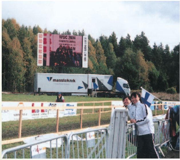
WOC閉会式後、スウェーデンの森と大型エキシビジョンをバックに

また遠征中に多くの人との出会いがあったこと、様々な文化を肌で感じる事が出来たことは、特に大きな収穫であった。