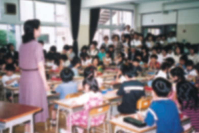
学習研究発表会 (附属小学校1年生)