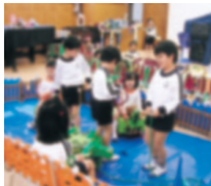
みんなで作った亀に 小さい組の友達をのせて遊ぶ (附属幼稚園)

小学校には一学年二学級ずつ全体で十二学級あり、男女の総定員は四八〇名である。基本方針は、「学習法」の伝統を生かした「じごと」「けいこ」「なかよし」による教育実践を通じ、子どもの学習生活