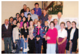
ファームステイ先で留学生+ホストファミリー先と

ポートや発表といった課題が次々と出されたときには正直焦りを感じました。けれども持ち前の集中力と負けん気の強さでとことん課題に取り組みました。大学には経験豊富な先生方が学生の学習をサポートするプログラムがあり、私はこのプログラムを最大限に活用しました。エッセイの書き方やノートの取り方、プレゼンテーションの仕方など様々な内容のワークショップがあり、個人的に課題を見てもらうこともできました。