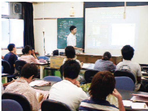
アカデミックガイダンスによる授業 (附属中等教育学校)

小学校には一学年二学級ずつ全体で十二学級あり、男女の総定員は四八〇名である。基本方針は、「学習法」の伝統を生かした「じごと」「けいこ」「なかよし」による教育実践を通じ、子どもの学習生活