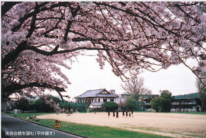
佐保会館を望む