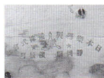
ピアノ木部につけられた印 (静岡県浜松町とある)