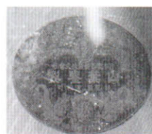
ピアノ木部につけられた 山葉シール