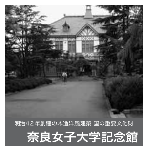
明治42年創建の木造洋風建築 国の重要文化財