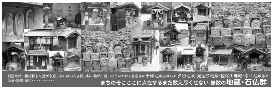
戦国時代の勇将松永久秀が承録三年に築いた多間山城の築城に用いたといわれる称名寺の千駄地藏をはじめ 夕日地藏・見返り地藏・佐保川地藏・幸せ地藏等々 奈良・鎌倉・室町..... まちのそこそこに点在するまだ数え不尽せぬ 無数の地藏・石仏群