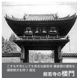
こずもす寺としても有名な般若寺 鎌倉期の優美な 建築様式を持つ 国宝