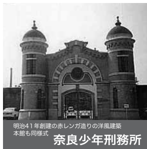
明治41年創建の赤レンガ造りの洋風建築 本館も同様式