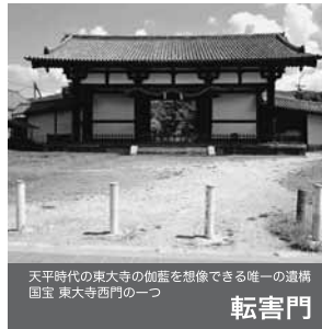
天平時代の東大寺の伽藍を想像できる唯一の遺構 国宝 東大寺西門の一つ

講堂の天井は、中央部を二重に折上げ、小壁に化粧の窓を設け、中央からシャンデリアを吊り下げている。