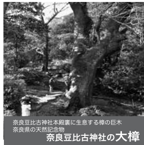
奈良豆比古神社本殿裏に生息する樹の巨木 奈良県の天然記念物