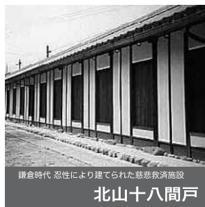
鎌倉時代 忍性により建てられた慈悲救済施設