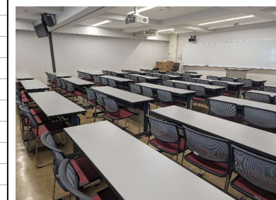
例2 イス移動可・3人掛け長机(N302)