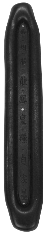
華烟飛龍鳳凰極貞家墨