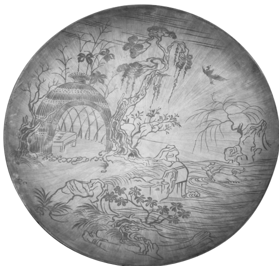
山水絵図密陀絵盆