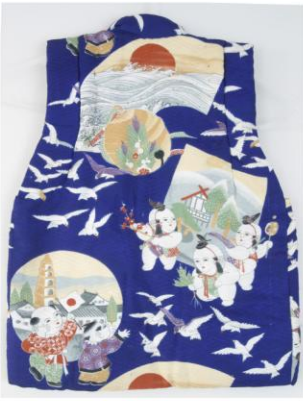
唐子御所人形柄一つ身