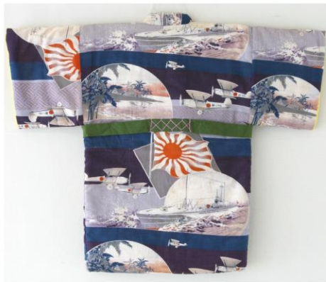
南洋潜水艦木箱一つ身