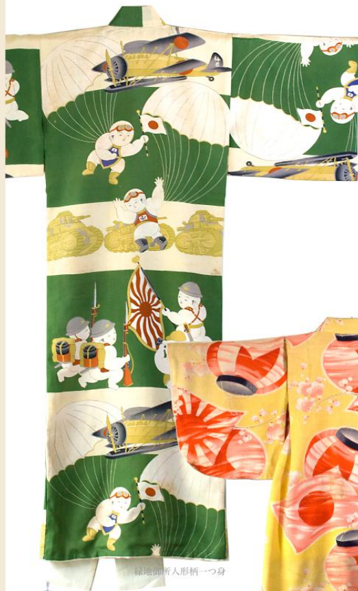
緑地画斬人形柄一つ身